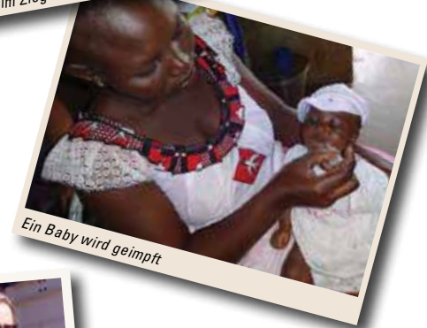
Ein Baby wird geimpft

Bilder aus unseren Jahresberichten. Gratisdownload über www.vez-bf.at