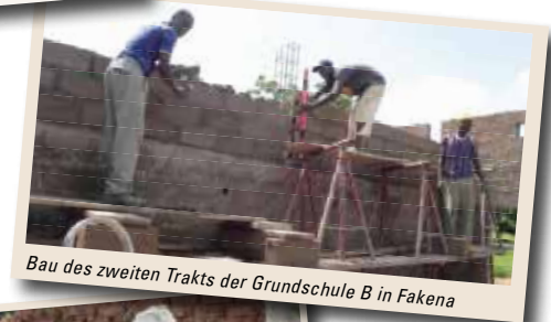
Bau des zweiten Trakts der Grundschule B in Fakena