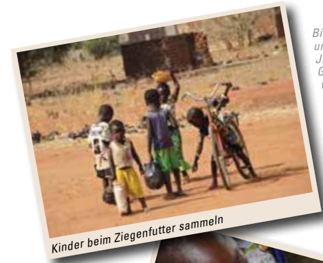
Kinder beim Ziegenfutter sammeln

Bilder aus unseren Jahresberichten. Gratisdownload über www.vez-bf.at