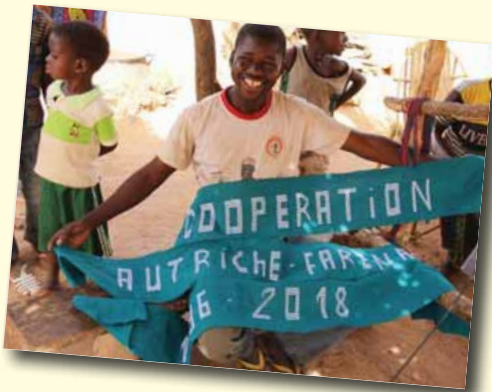
Handweber im Projektdorf Fakena